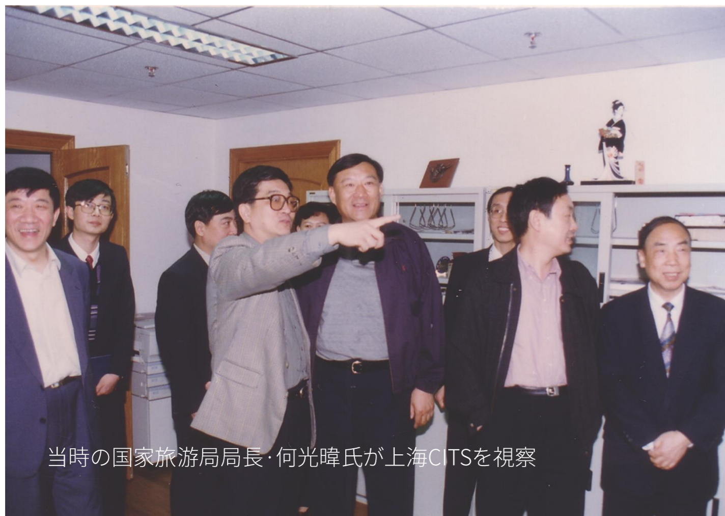
当時の国家旅游局局長・何光暉氏が上海CITSを視察