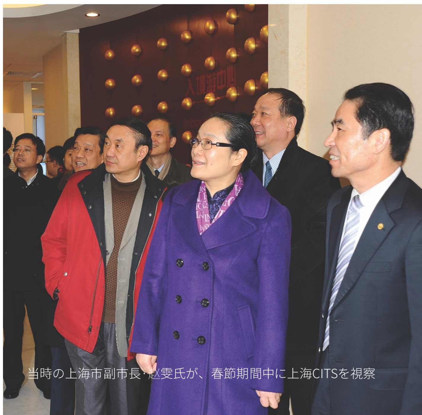
当時の上海市副市長・趙雯氏が、春節期間中に上海CITSを視察