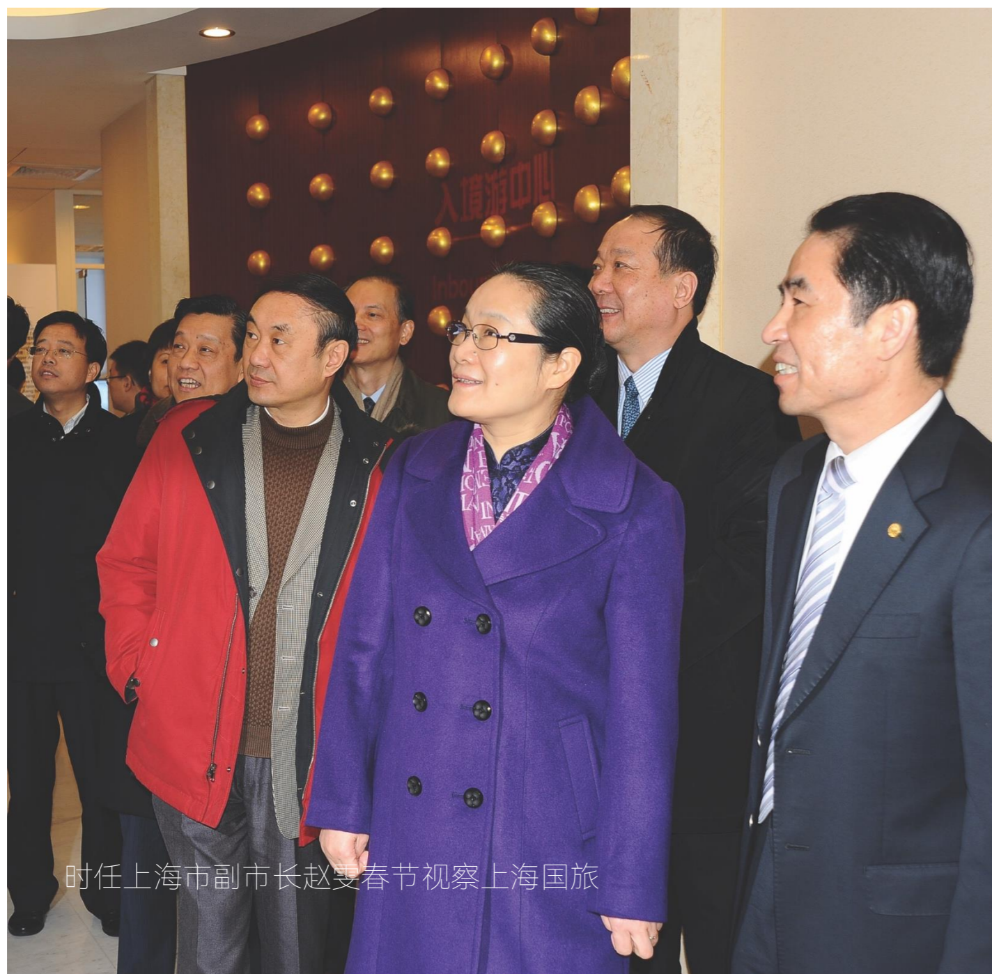
时任上海市副市长赵双春节视察上海国旅