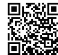
上海国旅京东专营店