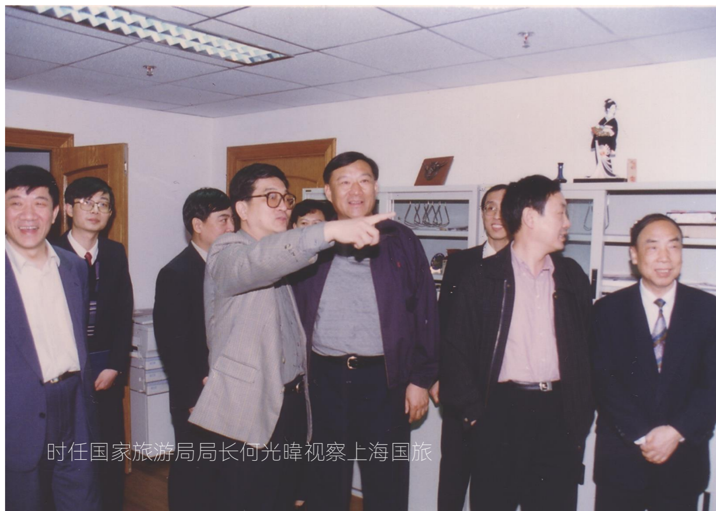
时任国家旅游局局长何光曄视察上海国旅